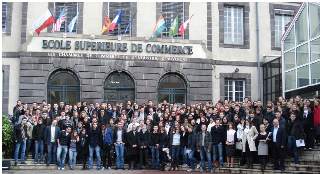
les élèves de 2 e année en partance pour l'international

L'Ecole accueille chaque année 40 visiting professors. Des accords d'échanges lient le Groupe ESC Clermont avec 110 universités dans le monde. Les 219 élèves de 2 e année qui entament actuellement un semestre d'études à l'étranger sont répartis dans 67 universités étrangères, c'est pourquoi, la gestion pédagogique des tutorats à l'étranger représente pour les enseignants et le Service International un suivi important. 44 étudiants briguent un double diplôme international. Une 100 e d'élèves encore est accompagnée par le Service Entreprises dans le cadre d'un stage en entreprise à l'étranger.